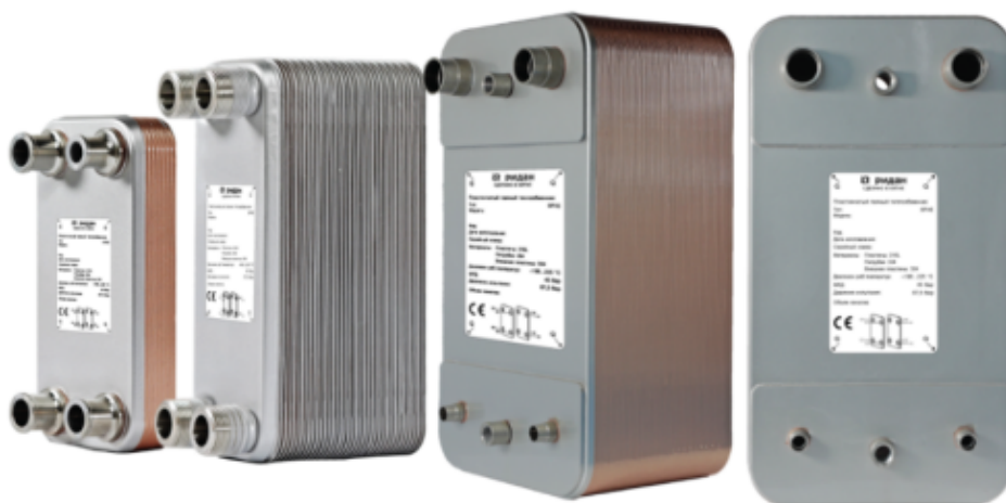
Рис.1 - Внешний вид теплообменников пластинчатых типа ВРНЕ

Теплообменники пластинчатые типа ВРНЕ предназначены для передачи тепловой энергии от одного теплоносителя к другому. Теплообменники пластинчатые типа ВРНЕ могут применяться в холодильных установках (компрессорных, абсорбционных), а также в тепловых насосах. В качестве рабочих сред могут использоваться с ГХФУ, ХФУ, ГФУ, ГФО и природные хладагенты не вступающие в реакцию с медью, технические и холодильные масла, вода для технических нужд и систем ГВС, спиртосодержащие растворы, водные растворы гликолей.